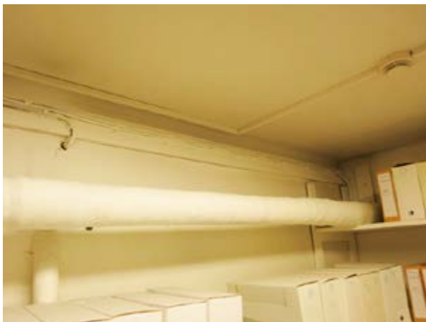
Mynd 12 Dæmi um vatnsleiðslur í skjalageymslum ráðuneytanna