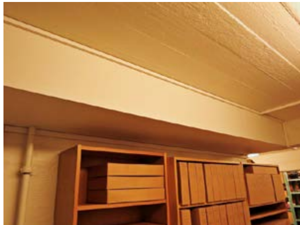
Mynd 11 Vatnsleiðslur klæddar í stokk í skjalageymslu eins ráðuneytis