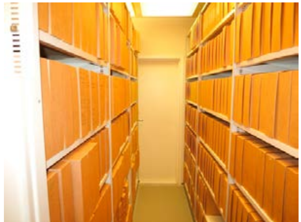
Mynd 2 Dæmi um hillur í skjalageymslum ráðuneytanna