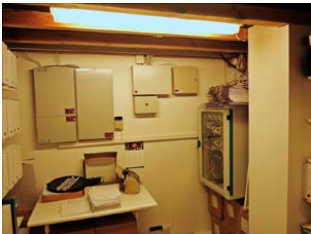
Mynd 16 Rafmagnstöflur og netþjónar í skjalageymslu ráðuneytis

Eins og með vatnsleka stafar skjölum einnig mikil ógn af eldi enda pappír góður eldsmatur. Huga verður vel að eldvörnum á þeim svæðum og í þeim rýmum sem hafa skjöl að geyma, annars vegar til að koma í veg fyrir að eldur brjótist út og hins vegar til að lágmarka tjón ef eldur verður laus. Í skjalageymslum ættu að vera reykskynjarar tengdir við miðlægt viðvörunarkerfi ásamt handvirkum brunaboðum. 9 Þá þurfa handslökkvitæki ávallt að vera til taks þó að sjálfvirkt slökkvikerfi sé til staðar í húsinu, ásamt því að brunaslanga sé til staðar sem ná til allra hluta byggingarinnar. 10