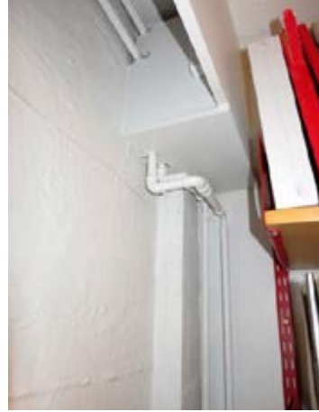
Mynd 9 Dæmi um vatnsleiðslur í skjalageymslum ráðuneytanna