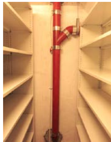
Mynd 13 Dæmi um vatnsleiðslur í skjalageymslum ráðuneytanna