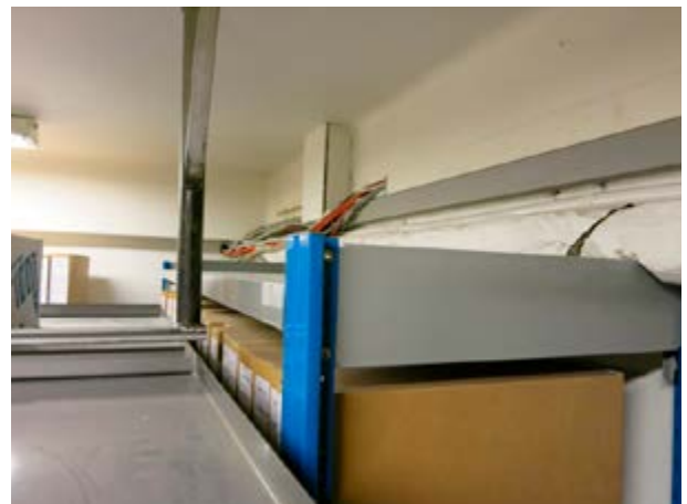
Mynd 17 Rafmagnsleiðslur í skjalageymslu ráðuneytis