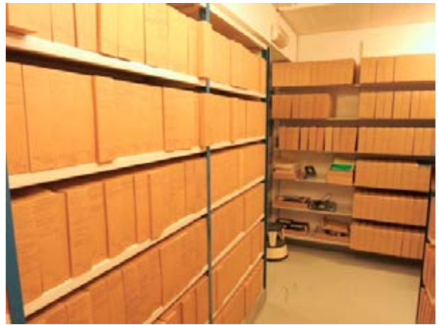
Mynd 1 Dæmi um hillur í skjalageymslum ráðuneytanna

Hjá öllum ráðuneytum þarf rafrænan lykil eða lykilkort til að komast inn í húsnæði viðkomandi ráðuneytis þannig að óviðkomandi eiga ekki aðgang inn á starfssvæði ráðuneytanna þar sem flestar skjalageymslurnar eru. Geymslurnar eru svo flestar læstar með hefðbundnum lykllum sem skjalastjórar geyma. Húsnæði allra ráðuneytanna er búið þjófavörnum en mælt er með því að hægt sé að fylgjast með því hvort hreyfing sé inni í skjalageymslum (spurning 2C). 4 Meirihluti ráðuneytanna er ekki með slíka skynjara í skjalageymslu sinni, aðeins tvö eru með hreyfiskynjara líkan þeim sem sést á mynd 5.