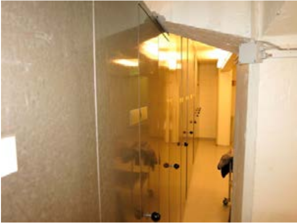
Mynd 4 Dæmi um hillur í skjalageymslum ráðuneytanna