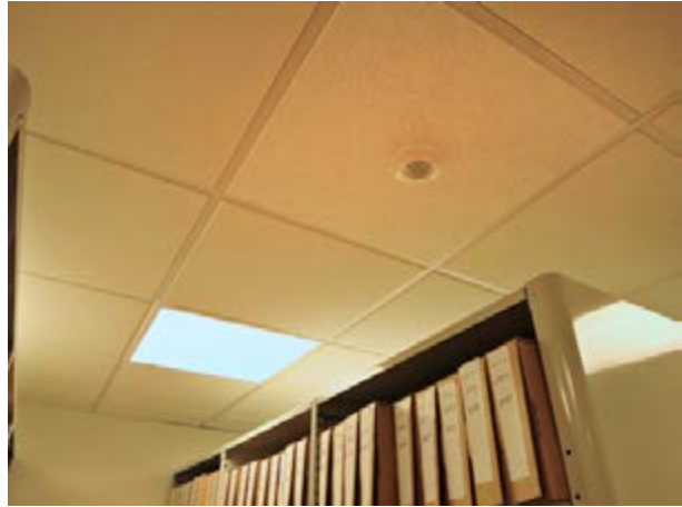
Mynd 5 Dæmi um hillur í skjalageymslum ráðuneytanna