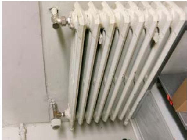
Mynd 6 Ofnar geta verið ástæða þess að hitastig er of hátt í skjalageymslum

Við mælingu á hita- og rakastigi í skjalageymslum ráðuneytanna var notaður stafrænn hita- og rakamælir. Þegar mælt var voru þrjú gildi tekin en mælirinn er þeim eiginleikum gæddur að mæla hitastigið eins og það var, þegar starfsmaður var í úttektarheimsókninni, ásamt því að mæla hitastigið sem það getur orðið hæst og lægst. Sama gildir þegar rakastig í skjalageymslum var mælt.