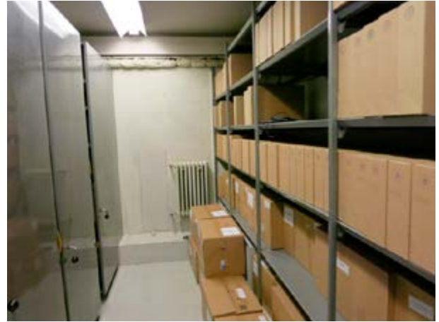
Mynd 15 Í kössunum á gólfinu eru geymd skjöl

Eins og talað er um í upphafi þessa kafla þá er gerð krafa um að hillur sem geyma skjöl séu ekki nær gólfinu en 15 cm og uppfylla níu skjalageymslur ráðuneytanna þær kröfur (spurning 2L). Þegar úttekt á skjalageymslunum fór fram voru í nokkrum ráðuneytum skjöl á gólfum en ljóst er að ef vatnstjón verður munu þau skjöl skemmast.