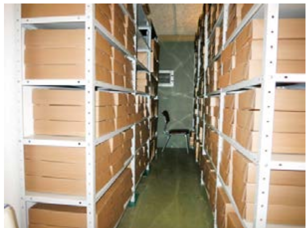
Mynd 3 Dæmi um hillur í skjalageymslum ráðuneytanna