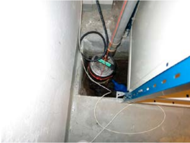
Mynd 14 Brunnðæla í gólfi skjalageymslu eins ráðuneytis