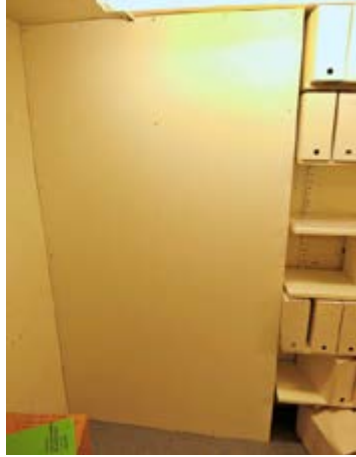
Mynd 8 Bakvið vegginn eru vatnsleiðslur

Frágangur vatnsleiðslna í geymslum er á ýmsa vegu, í sumum skjalageymslum er smíðaður stokkur utan um leiðslurnar sem getur tafið vatnsleka en hjá öðrum ráðuneytum eru vatnsleiðslurnar berar, sjá myndir 9-14 (spurning 2E).